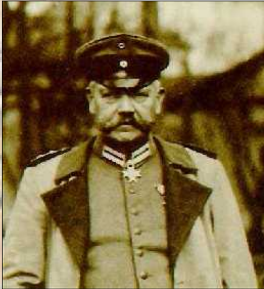
Paul Von Hindenburg